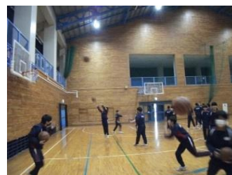
【伸び伸びと体育の授業】