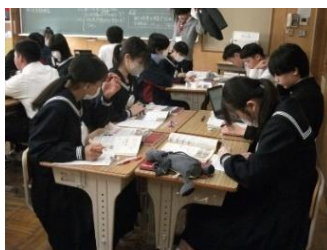
【これまでの総仕上げ】

3年生は、各自進路決定に向けて追い込みの時期です。どの授業でも総復習が行われています。個人で、そして友達と「分かる」「できる」をふやしていました。体育では、伸び伸びと体を動かしていました。