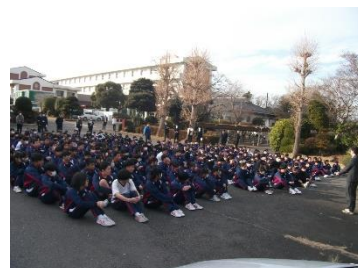
【担当教員からの振り返り】