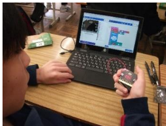
【思ったようになる?】

2年生では、プログラミングの授業がありました。思い通りの動作になるよう試行錯誤していました。また、分からないことを教科書やタブレットを使って調べるなど、各自の課題解決が進んでいました。