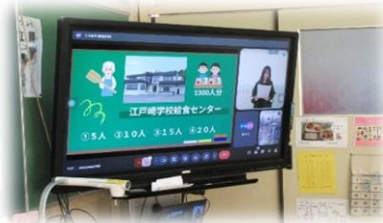
給食委員会によるクイズ