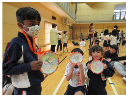
【プレゼントありがとう】