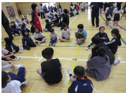
【自己紹介「よろしくね」】

4月28日（月）に、1年生を迎える会を行いました。児童会が中心となり企画・運営をしました。たてわり班ごとに、一人一人が自己紹介をし、その後、全員が手をつなぎ、協力してフラフープをくぐるゲームを行うなど、楽しい時間を過ごしました。また、2年生から手作りの素敵なメダルがプレゼントされるなど、心温まる楽しい会になりました。