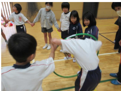
【フラフープくぐり】